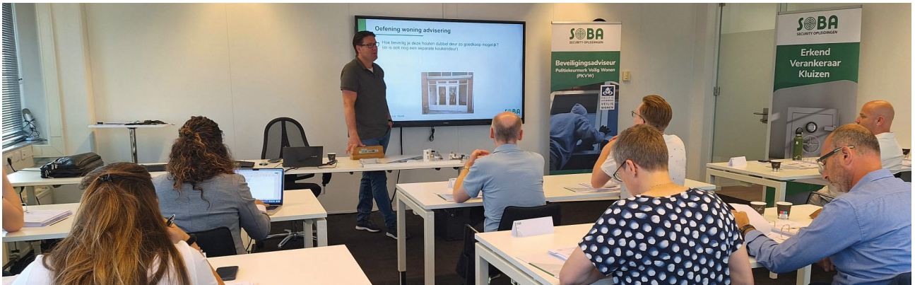
Opleiding SOBA PKVW-adviseur

Op dinsdag 8 en woensdag 9 oktober zijn PKVW-adviseurs aanwezig op de Voorlichtingsdagen van VvE Belang . Op de informatiemarkt geven zij de bezoekers voorlichting en adviezen over de beveiliging van appartementencomplexen en de appartementen zelf.